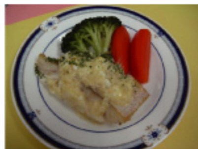
白身魚のタルタル焼き