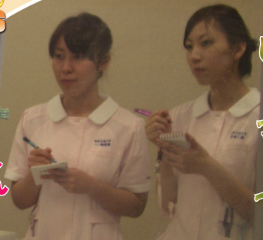
さやま総合クリニック、狭山病院では、西武文理大学看護学部と提携し、学生の実習を受入れています。ベテラン看護師の指導のもとより、直接かかわった患者さんからも教えていただくことがたくさんあるそうです。